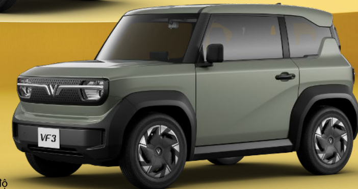
XANH LÁ NHẬT - URBAN MINT