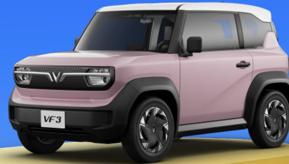
HỒNG (ROSE PINK) + NÓC TRẮNG