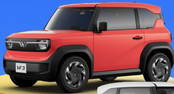
ĐỎ - SOLAR RUBY**