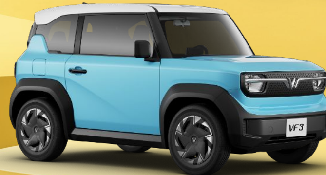
XANH DƯƠNG (SKY BLUE) + NÓC TRẮNG