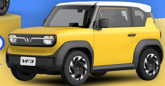
VÀNG (YELLOW SUMMER) + NÓC TRẮNG