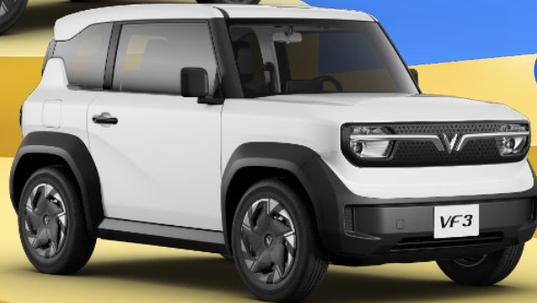
TRẮNG - INFINITY BLANC