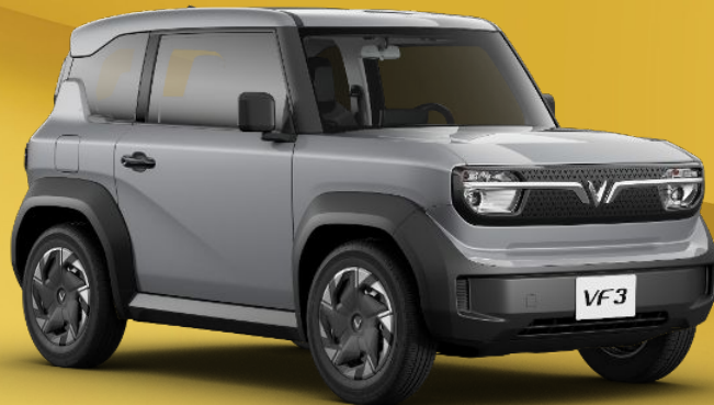
XÁM - ZENITH GREY